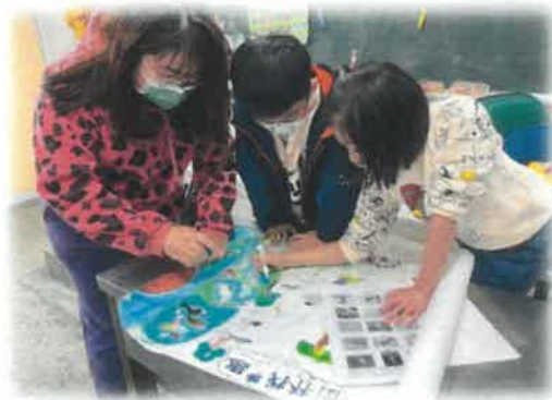
討論：看看鷺出現在哪裡？

4. 認識家鄉 希望大家有機會可以來樹林走走，來到我們的家鄉，這裡有一個美麗的鹿角溪溼地，是我們的好鄰居！散步、騎車、賞鳥都非常適合唷。