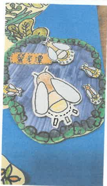
學校復育的螢火蟲