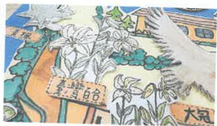
學校復育的台灣百合