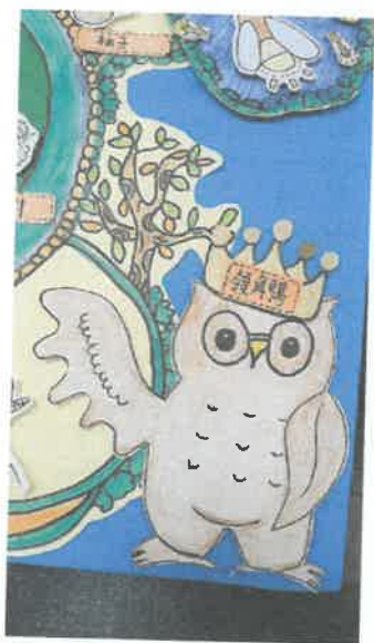
學校人氣王-領角鴉