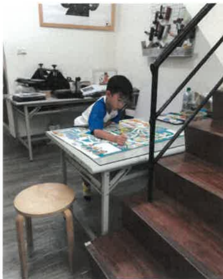
（QQ 對於畫不滿意的地方，自己下課後又來修補）