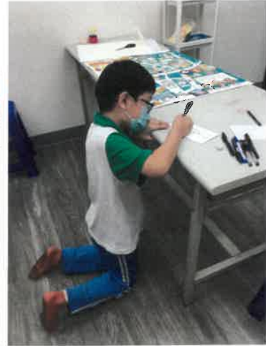
（小杰為了寫字，和他媽媽把文具店好用的比都買來練習）